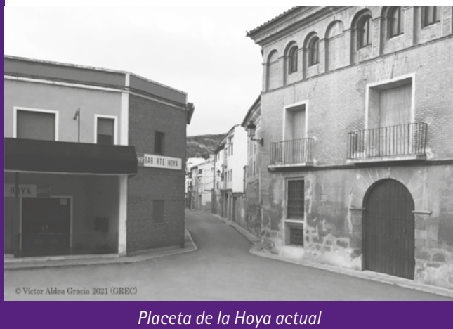
© Victor Aldea Gracia 2021 (GREC)