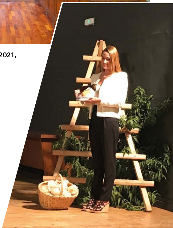
Mireia Belmonte, recibe el Galardón Melocotón de Oro