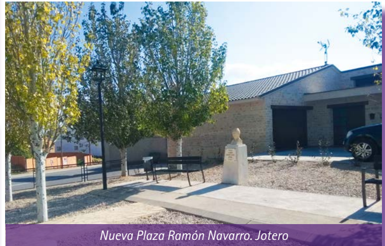
Nueva Plaza Ramón Navarro. Jotero