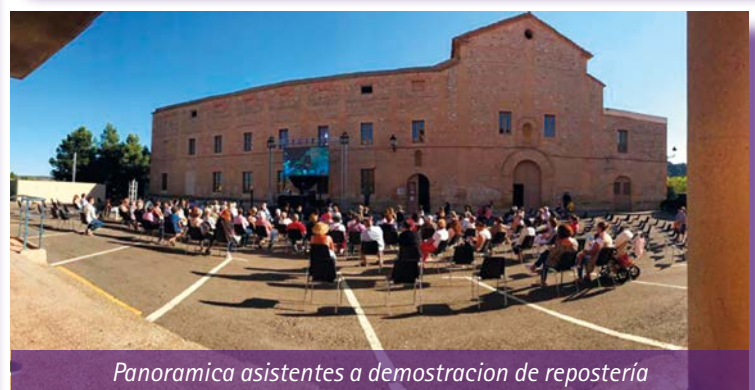
Panoramica asistentes a demostracion de repostería