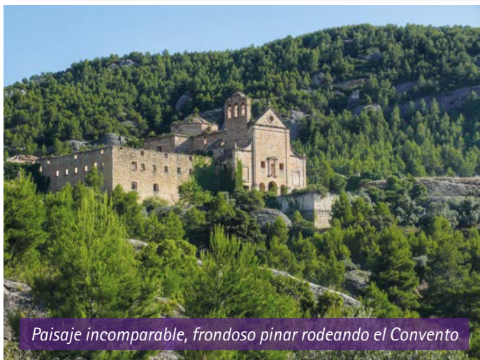
Paisaje incomparable, frondoso pinar rodeando el Convento

CRISTO VENCE, CRISTO REINA, CRISTO IMPERA DE TODO LO MALO NOS LIBRE Y NOS DEFIENDA 1701