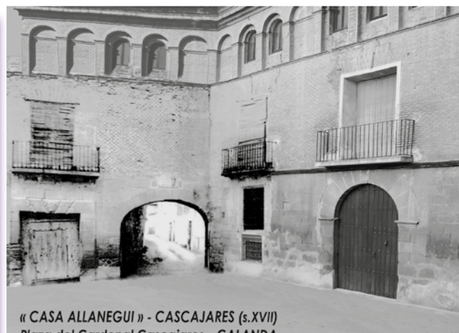
© Victor Aldea Gracia 2021 (GREC)