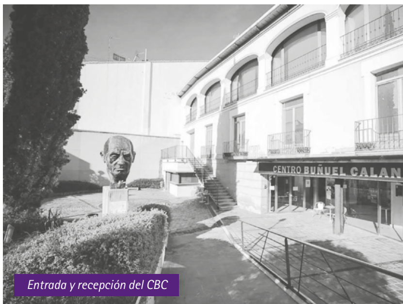
Entrada y recepción del CBC

No es este el único 'tesoro español', pues la Plaza de España de Sevilla o el Desierto de Tabernas (Almería) han sido igualmente distinguidos por la EFA ■