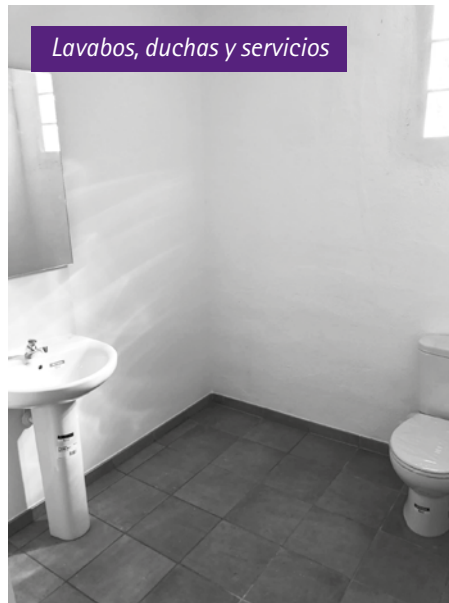
Lavabos, duchas y servicios

Se han efectuado unas obras de mejoras en la plaza de toros. Las dependencias que había al entrar por la puerta principal a la derecha, se han transformado en dos vestuarios adecuados a los servicios de higiene y movilidad y un nuevo bar se ha situado en los palcos de sombra. Unos nuevos servicios y espacios que servirá para albergar espectáculos de diversa índole, más en estos tiempos donde es recomendable dar espectáculos al aire libre y la plaza de toros reunía estas condiciones, pero le faltaban unos vestuarios conforme a los tiempos presentes ■