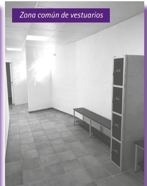
Zona común de vestuarios