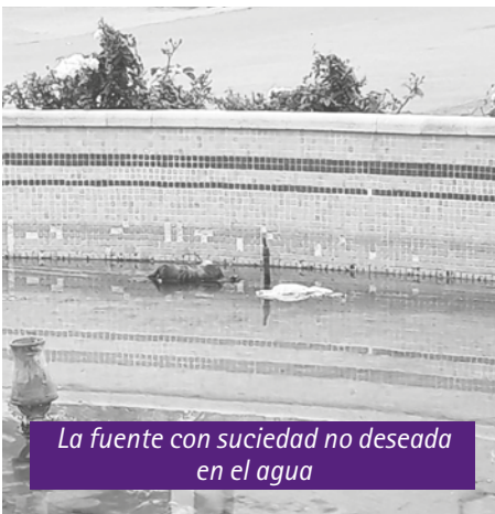
La fuente con suciedad no deseada en el agua

A LIAGAS BIEN GRANDES Y PUNTIAGUDAS. Seguimos y no nos cansaremos, denunciando siempre en nuestras páginas, la falta de civismo de ciertas personas y los actos vandálicos de "personajillos descerebrados" que siguen practicando a sus anchas. Esta vez ha sido un banco del Parque Cerrado de la Baronesa, el que ha sido destrozado con malicia, ensañamiento y falta de respeto hacia una sociedad que trabaja, vive y se empeña en la convivencia la paz y armonía con sus semejantes y su entorno, pero existen unos "individuos" que al parecer todavía se manejan a cuatro patas. Unos bancos, unas zonas ajardinadas y unos árboles, sirven para el recreo, descanso y el bienestar de los vecinos. Los que practican estos destrozos deberían habitar terrenos perdidos en una selva o encerrados en porquerizas ■