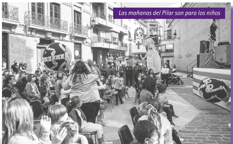
Las mañanas del Pilar son para los niños