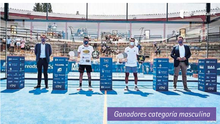
Ganadores categoría masculina

Por último, a los niños y niñas de Calanda que hicieron de recogepelotas durante todo el torneo con la ilusión de estar al costado de los mejores jugadores de pádel que pisan la tierra ■