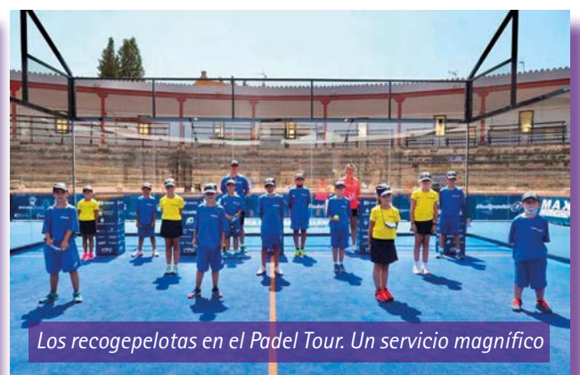
Los recogepelotas en el Padel Tour. Un servicio magnífico