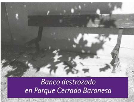
Banco destrozado en Parque Cerrado Baronesa

A LIAGAS BIEN GRANDES Y PUNTIAGUDAS. Seguimos y no nos cansaremos, denunciando siempre en nuestras páginas, la falta de civismo de ciertas personas y los actos vandálicos de "personajillos descerebrados" que siguen practicando a sus anchas. Esta vez ha sido un banco del Parque Cerrado de la Baronesa, el que ha sido destrozado con malicia, ensañamiento y falta de respeto hacia una sociedad que trabaja, vive y se empeña en la convivencia la paz y armonía con sus semejantes y su entorno, pero existen unos "individuos" que al parecer todavía se manejan a cuatro patas. Unos bancos, unas zonas ajardinadas y unos árboles, sirven para el recreo, descanso y el bienestar de los vecinos. Los que practican estos destrozos deberían habitar terrenos perdidos en una selva o encerrados en porquerizas ■