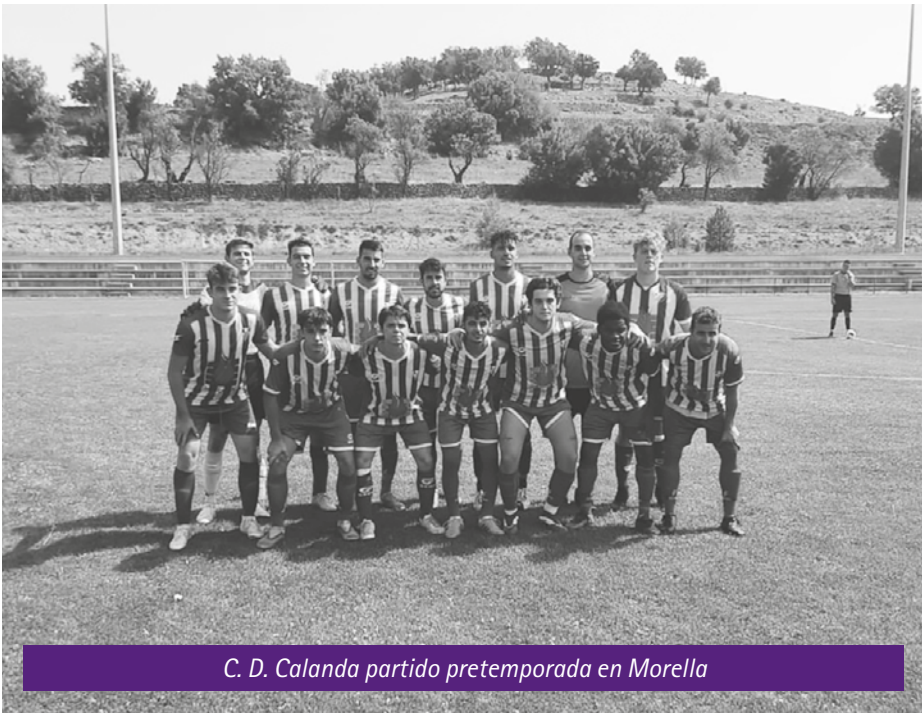
C. D. Calanda partido pretemporada en Morella