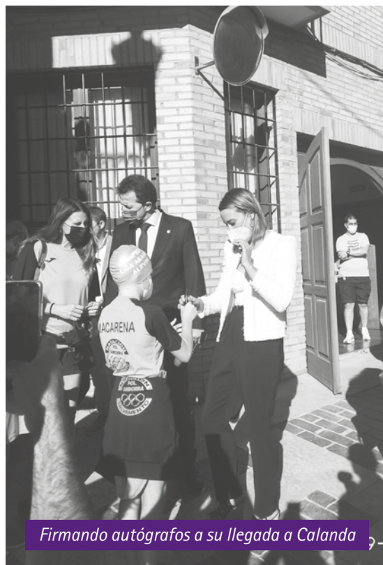
Firmando autógrafos a su llegada a Calanda

El alcalde entregó una litografía de Luis Buñuel a Mireia Belmonte como recuerdo de este acto. Tomaron la palabra Isabel Zabal y Raquel Palos, portavoces del PP y PSOE, agradeciendo su presencia en Calanda y resaltando sus cualidades como mujer y deportista de élite mundial ■