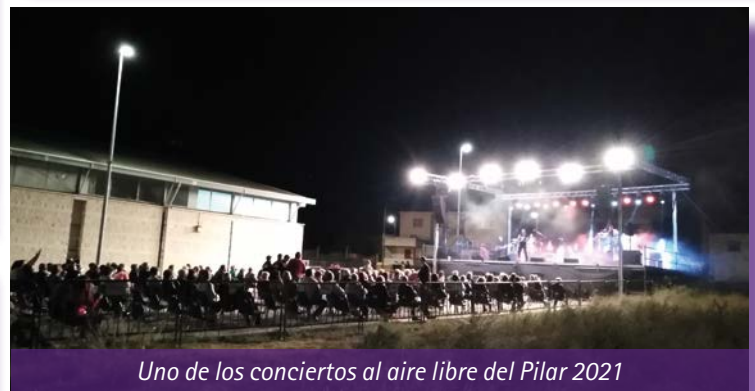
Uno de los conciertos al aire libre del Pilar 2021