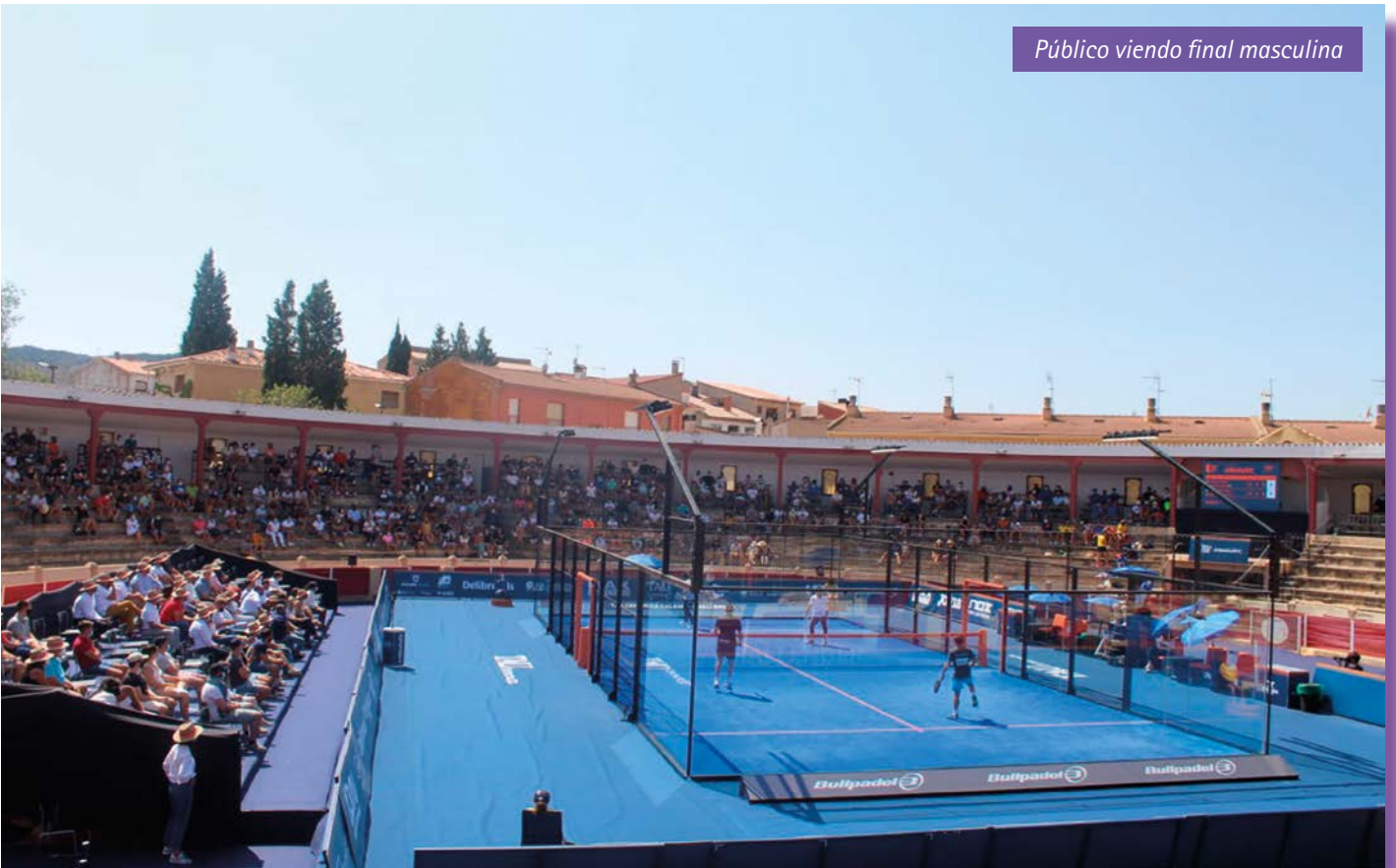
Público viendo final masculina

Haciendo balance, más de 2.000 personas discurrieron por nuestro municipio durante el torneo, lo que supuso una semana de completa ocupación hotelera en las villas de Calanda y Alcañiz, además de un fuerte impulso al resto del sector de la hostelería.