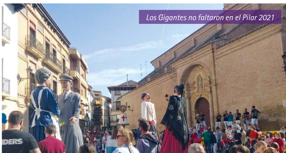
Los Gigantes no faltaron en el Pilar 2021

El sábado día 16. Día de las Personas Mayores. Misa en el Templo del Pilar y por la tarde en el Pabellón de Festejos actuación del " La Trova", grupo de Ejea de los Caballeros con un repertorio de canciones del folklore aragonés y navarro, pasodobles, rancheras, corridos mejicanos y canciones populares de todos los tiempos. Todo un éxito que el público asistente premio con grandes aplausos ■