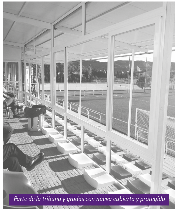
Parte de la tribuna y gradas con nueva cubierta y protegido

Recientemente se han efectuado unas obras en campo de futbol "Manuel Cros". Se ha alargado la zona de tribuna cubierta que hasta ahora solo afectaba a la zona de bar, se ha dado un paso importante cubriendo parte de los asientos de la grada. Además, se ha protegido el frente de la parte superior de las gradas con unos grandes ventanales con cristales correderos. Unas mejoras que sobre todo en invierno o en días desapacibles permitirá ver los partidos con toda comodidad, protegidos de la lluvia, viento o frío ■