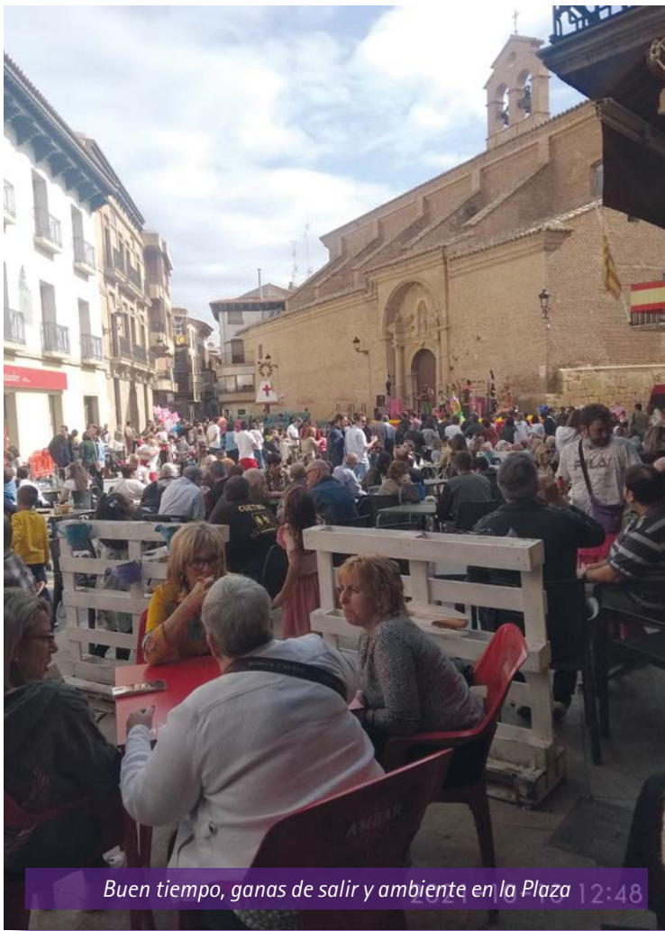
Buen tiempo, ganas de salir y ambiente en la Plaza 12:48