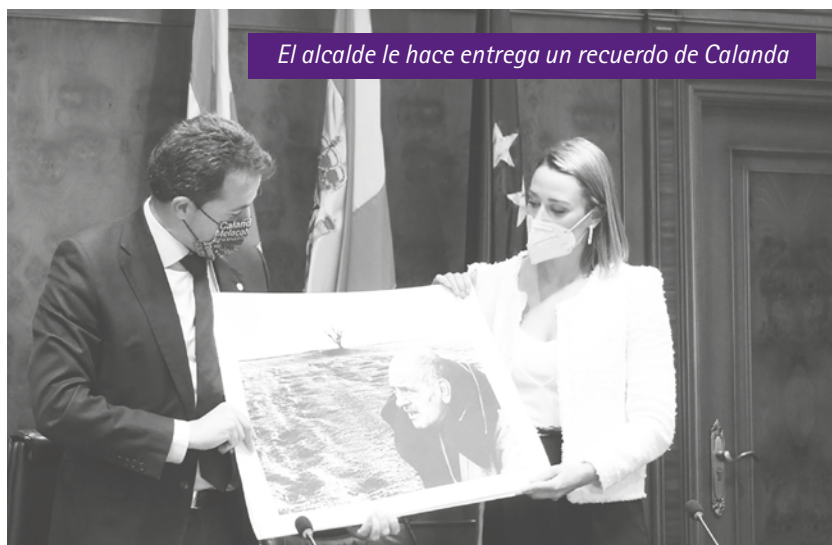
El alcalde le hace entrega un recuerdo de Calanda