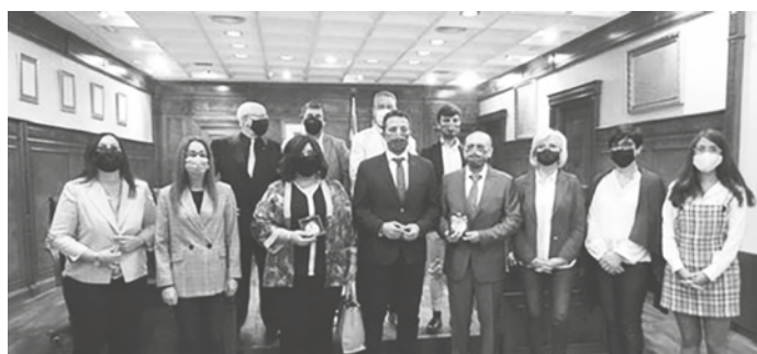
Corporación Municipal, Juez de Paz y directores de Colegio e Instituto en la entrega de la Medalla