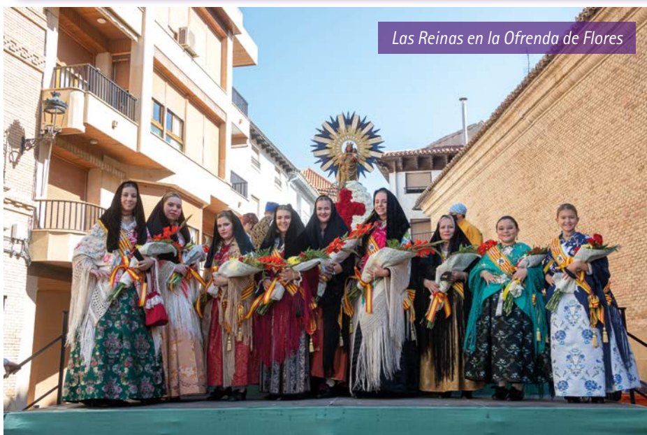
Las Reinas en la Ofrenda de Flores