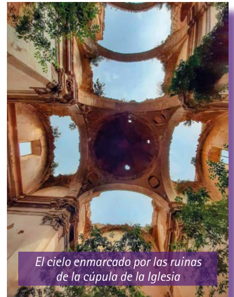
El cielo enmarcado por las ruinas de la cúpula de la Iglesia

Manuel Conesa, a pesar de ser un simple aficionado a la fotografía, nos lo muestra con maestría, haciendo gala de un gusto excepcional, nos acerca las bellezas y los parajes de merecen la pena ser visitados, lugar donde no faltan las fuentes, rodeado de un frondoso pinar. Ahora que es propiedad municipal todos debemos visitarlo, conocerlo y respetarlo después de tantos años en el olvido y abandono total, expuesto a las inclemencias y el vandalismo de algunos de los visitantes ■