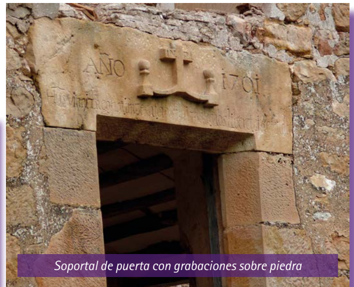
Soportal de puerta con grabaciones sobre piedra

IHS VINCIT REGNAT IMPERAT AB OMNI MALO NOS LIBERET ET DEFENDAT 1701