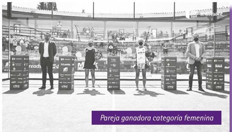
Pareja ganadora categoría femenina

Tal fue el impulso del melocotón, que los ganadores del TAU Cerámica Calanda Challenger (Trofeo Ciudad de Alcañiz) vencieron en la semana siguiente en el Cascais Padel Máster a la pareja formada por Fernando Belasteguín y Sanyo Gutiérrez, dos de los mejores jugadores de la historia (número 3 y 5 del ranking WPT al instante en que se escriben estas líneas).