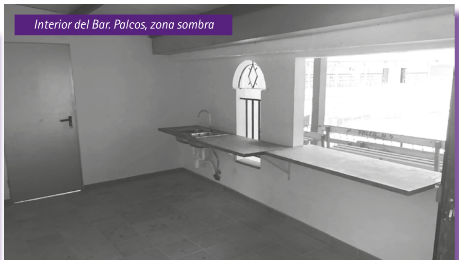
Interior del Bar. Palcos, zona sombra