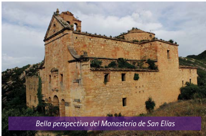
Bella perspectiva del Monasterio de San Elías