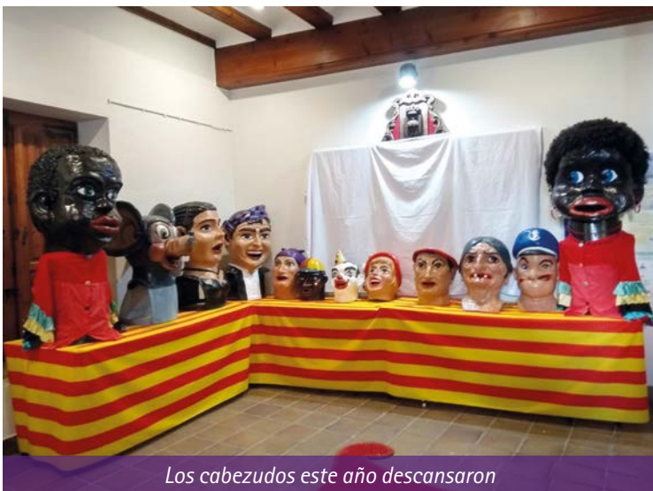
Los cabezudos este año descansaron