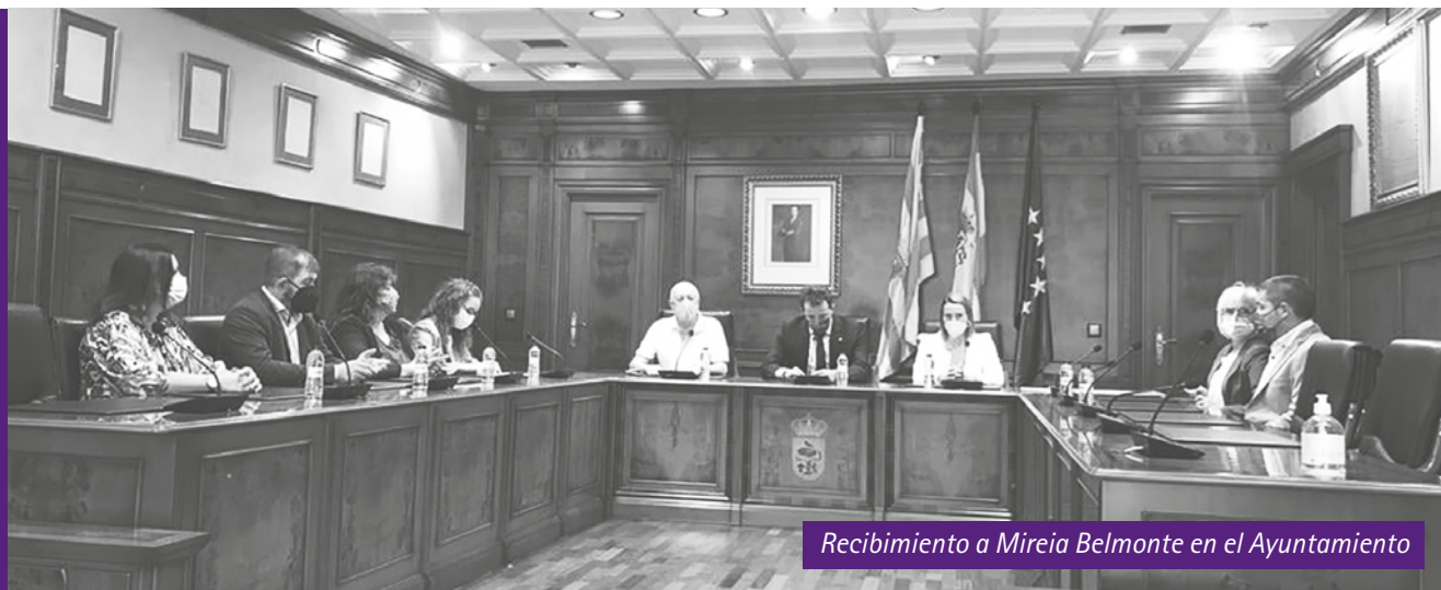
Recibimiento a Mireia Belmonte en el Ayuntamiento