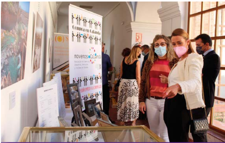
Mireia Belmonte, visitando la Exposición fotográfica