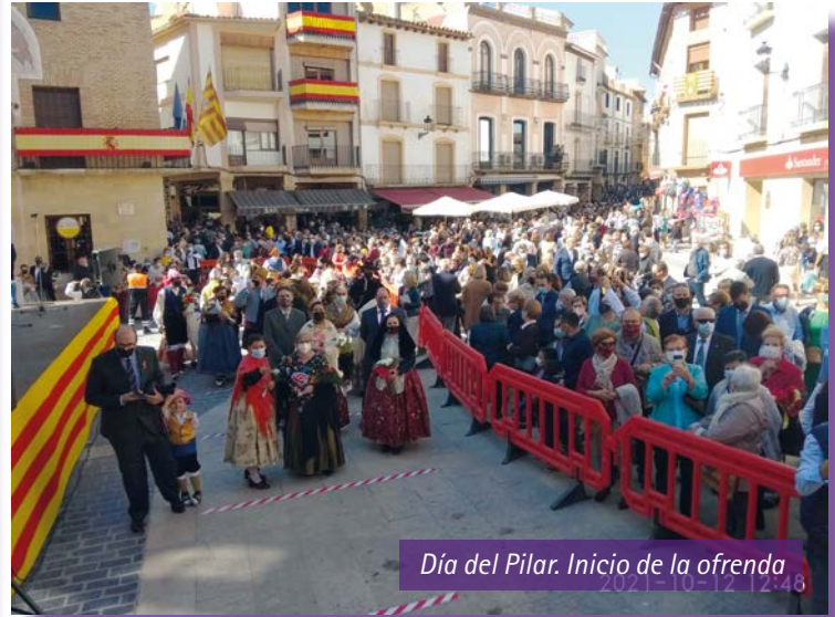
Día del Pilar. Inicio de la ofrenda 2021-10-12 12:48