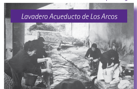
Lavadero Acueducto de Los Arcos