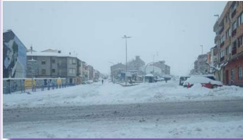
Carretera Andorra y Paseo Alcañiz, cubiertos de nieve