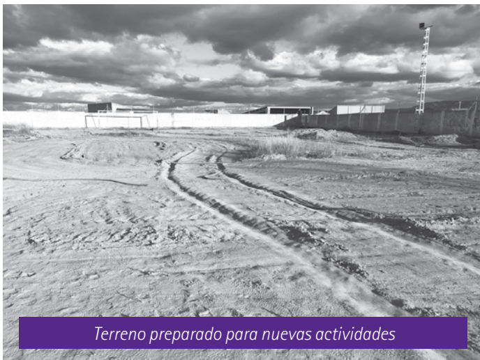
Terreno preparado para nuevas actividades

Los integrantes de todos estos grupos y asociaciones ocupan sus ratos libres entrenando y compitiendo en esta renovada Ventolera, siendo además ellos los encargados de su mantenimiento. Esperamos se mantengan estas actividades que diversifican las actividades deportivas de nuestra localidad y animamos a todos los calandinos a interesarse por ellas ■