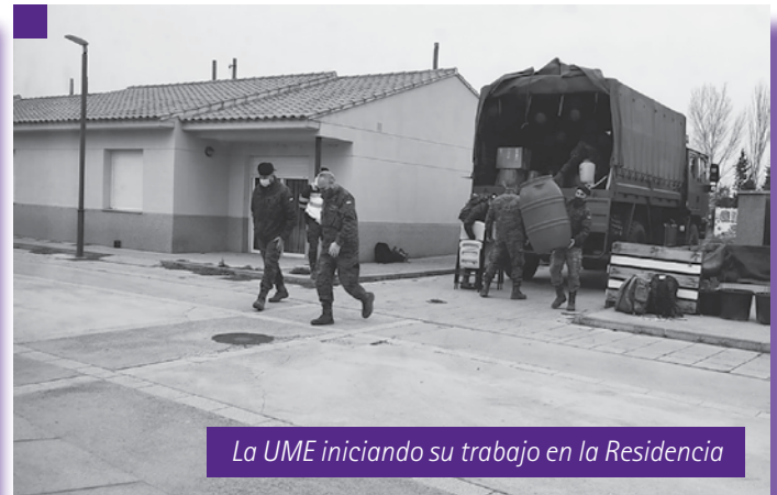
La UME iniciando su trabajo en la Residencia