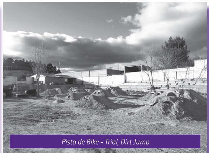
Pista de Bike - Trial, Dirt Jump