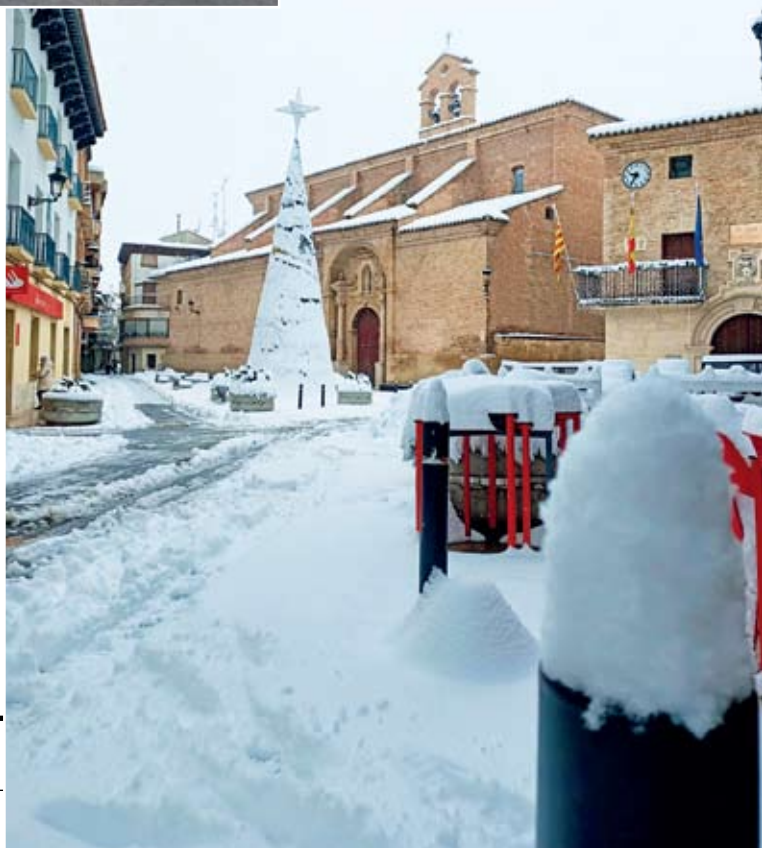
Plaza España y Árbol navideño con un manto blanco.