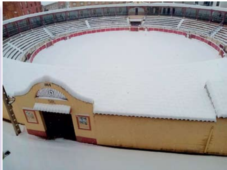
Vista inusual de la Plaza de Toros