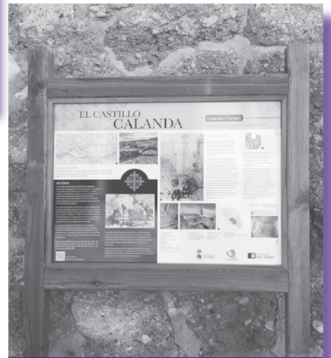
Cartel de la Comarca del B. Aragón en la subida del Castillo

L aurel grande, a los carteles que se han empezado a colocar en edificios y lugares de interés para información referida al lugar donde se encuentran instalados. Una idea magnífica para dar a conocer un poco más nuestra Historia, tanto para los habitantes de Calanda, siempre es bueno ampliar la Cultura de tu pueblo, como para los que nos visitan y estén informados de lo que tenemos y les ofrecemos. De momento se han colocado en la fachada del Ayuntamiento, Parroquia de la Esperanza, Templo del Pilar, Arco San Roque. La Comarca del Bajo Aragón lo ha colocado en el muro del Castillo en la Plaza del Pilar. Gran Laurel para esta iniciativa.