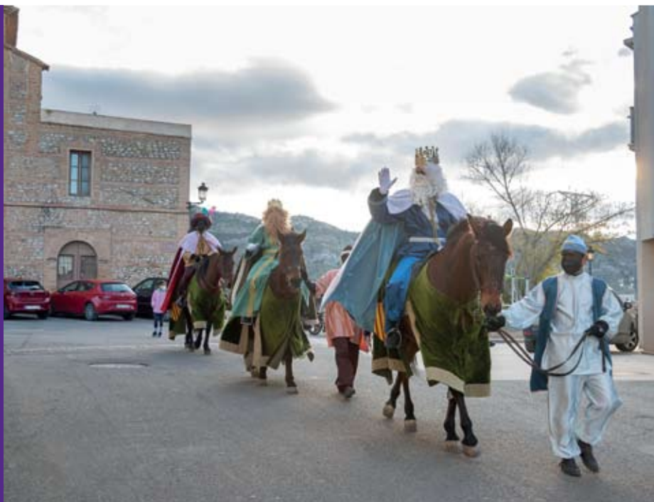
Los Reyes Magos visitaron Calanda