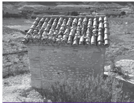
Ermita del Calvario con tejas rotas

A LIAGAS, gordas y puntiguadas, a los vándalos que aún quedan sueltos y campan por sus anchas. Otra vez la han tomado con el Calvario, esta vez con el tejado de una de las ermitas que señalizan las estaciones. Por lo visto han lanzado grandes piedras y han destruido parte de su tejado. ¿Se pueden hacer estos actos bárbaros solamente por el placer de hacer daño?