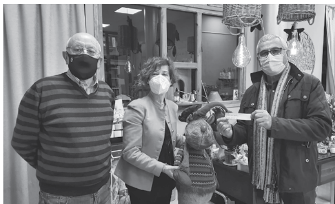
El Presidente de ASAPME saca el boleto premiado en presencia del Juez de Paz y la propietaria de EL Banastro.