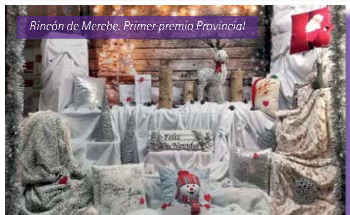
Rincón de Merche. Primer premio Provincial