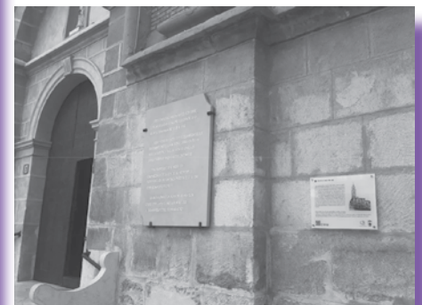
Detalle de ubicación en el Templo del Pilar