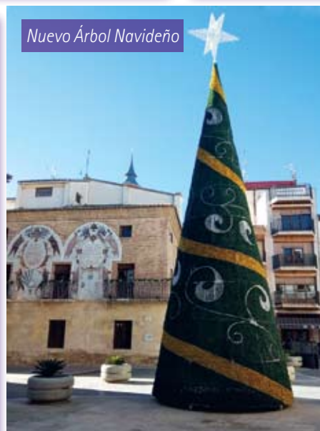
Nuevo Árbol Navideño