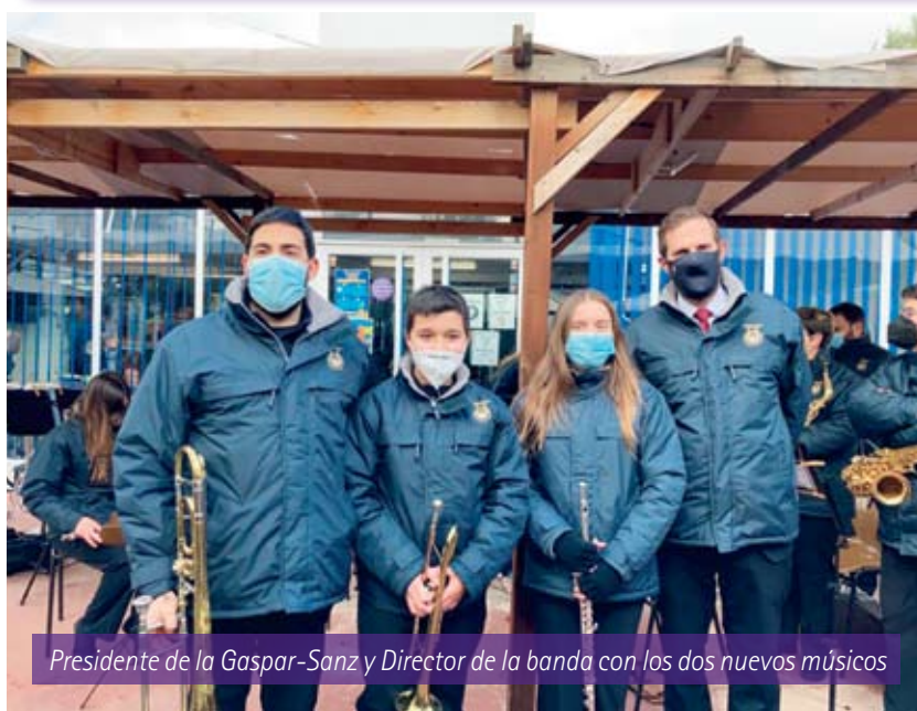
Presidente de la Gaspar-Sanz y Director de la banda con los dos nuevos músicos