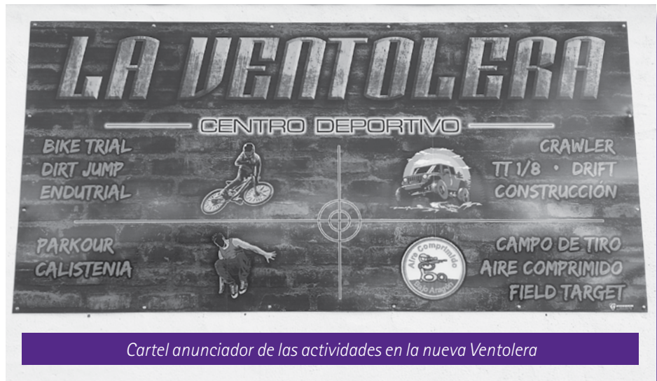
Cartel anunciador de las actividades en la nueva Ventolera

Habiendo colocado diversos obstáculos como ruedas de camión o tuberías de hormigón, realizan habilidosos saltos con sus bicicletas adaptadas para tal fin. Este deporte nacido en España destaca por sus acrobacias.