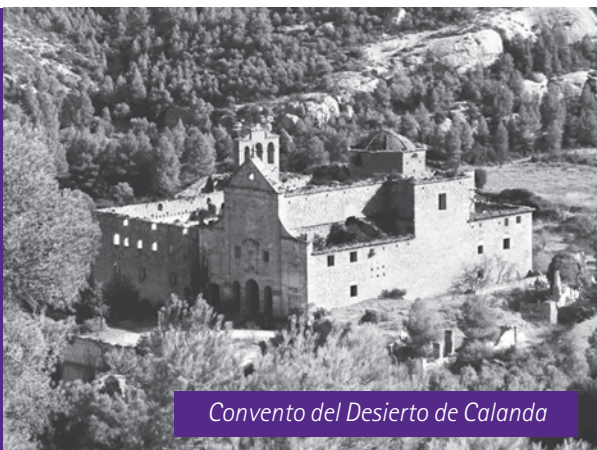
Convento del Desierto de Calanda

En Agosto, Calanda se convertirá en la Capital del Pádel y se celebrará el Torneo Internacional que organiza el World Pádel Tour y que tiene previsto participen 298 jugadores, 98 de ellos en categoría femenina. Se estima que para este acontecimiento, se desplacen hasta Calanda, alrededor de 2.600 aficionados a este deporte!! ■