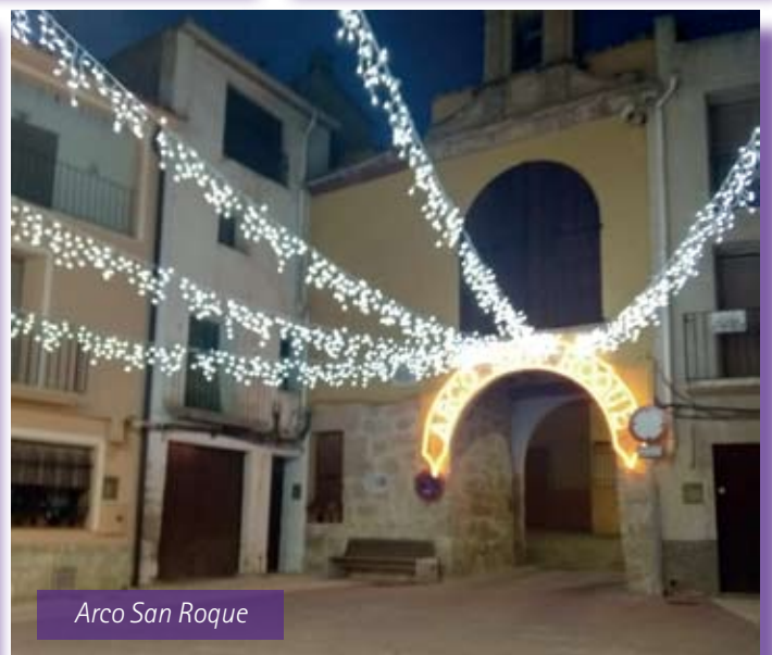
Arco San Roque