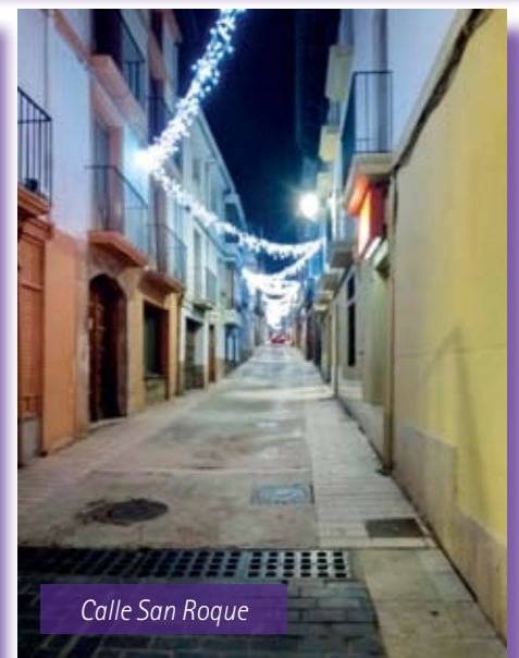
Calle San Roque