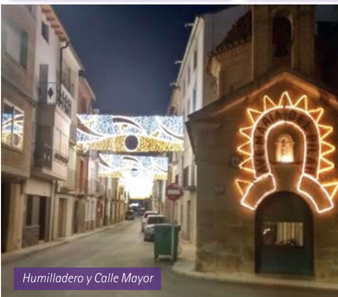
Humilladero y Calle Mayor