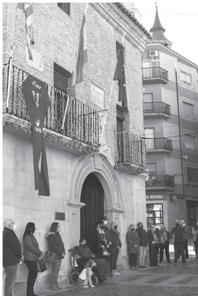
Manifiesto y minuto de silencio en favor de la Lucha contra la Violencia

Que el silencio sólo se aguarde como conmemoración, jamás como alternativa ante el temor, ante el señalamiento social, y mucho menos ante la complicidad frente a la violencia. Sociedad civil de Calanda: ¿Somos conscientes de las formas que ha tomado la violencia y que se ha ido naturalizando en nuestros espacios de convivencia? ¿Estamos dispuestos (as) a romper con el silencio y a sumar voluntades para esta lucha? ■