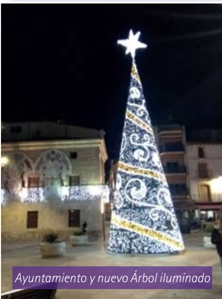
Ayuntamiento y nuevo Árbol iluminado