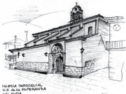
IGLESIA PARROQUIAL N.S. de la ESPERANZA CALANDA

La parroquial calandina es el centro de la mayoría de las celebraciones religiosas durante la Semana Santa, declarada Patrimonio Inmaterial de la Humanidad por la UNESCO. Ante ella se produce la famosa rompida, y de ella parten todas las procesiones como viene sucediendo desde tiempos inmemoriales.