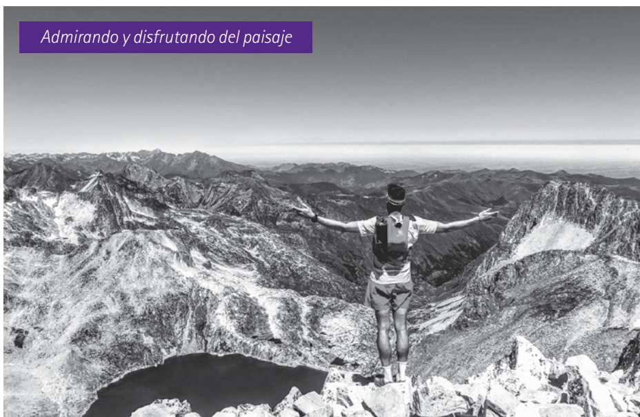
Admirando y disfrutando del paisaje

Tras cuatro años en Bronchales surgió la posibilidad de seguir mi actividad en la Farmacia de Calanda. Parece que fue ayer pero ya ha transcurrido casi un año y medio. Ha sido un año muy intenso con mucho trabajo y dedicación sintiéndome querido y agradecido con todo el pueblo de Calanda y Foz Calanda. La verdad es que me considero un calandino más ■