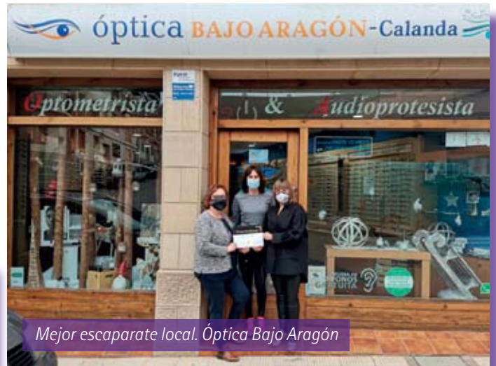
Mejor escaparate local. Óptica Bajo Aragón