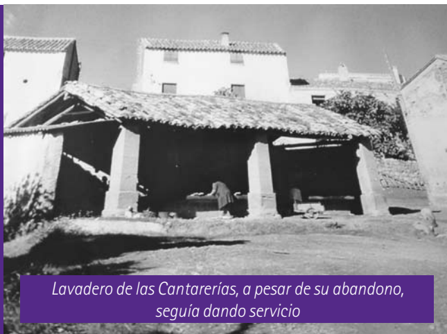
Lavadero de las Cantareras, a pesar de su abandono, seguía dando servicio