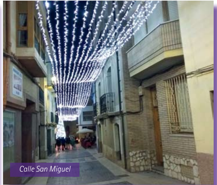
Calle San Miguel