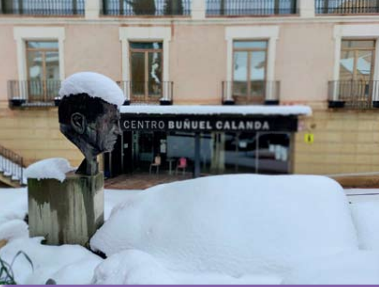
Patio del CBC