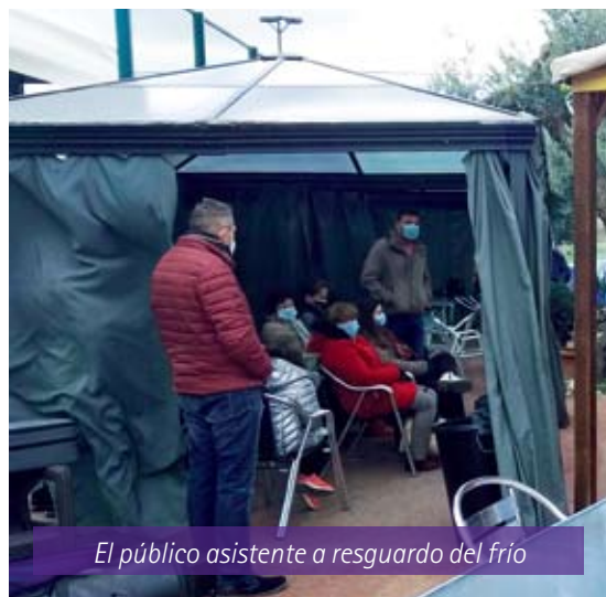
El público asistente a resguardo del frío

Como resumen, unos momentos esperados con verdaderas ganas, tanto por los músicos que echaban en falta la relación con los compañeros, los ensayos y actuar en vivo con público, igualmente los asistentes comentaban que estaban con ganas de oír música en directo y qué mejor para empezar el año, que pasar un rato muy agradable a pesar del frío, escuchando a nuestra Asociación Musical Gaspar Sanz. A resaltar la conducta de estos músicos que superando la climatología, dieron un ejemplo de sacrificio y pundonor, por lo que más les gusta, la MÚSICA.