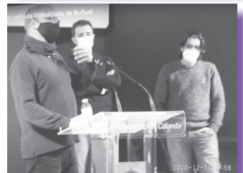
Director del CBC, Alcalde de Calanda y Director de la Filmoteca, presentando la película