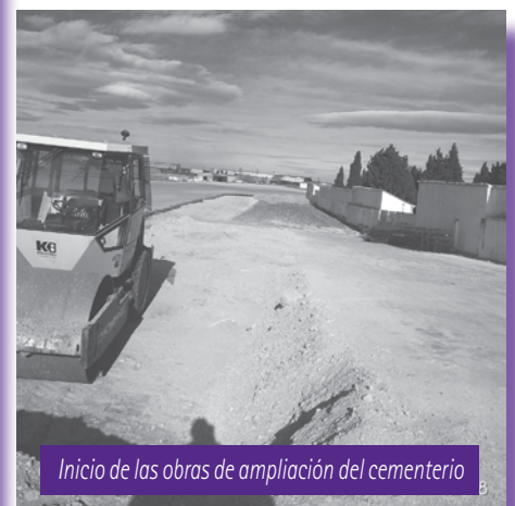
Inicio de las obras de ampliación del cementerio