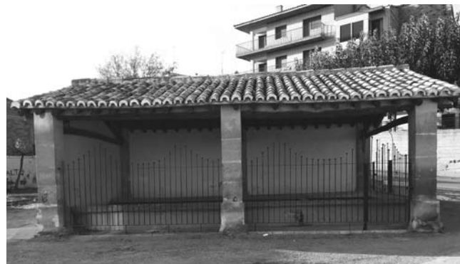
Lavadero Cantareras, desde hace unos años restaurado y protegido.