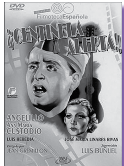
Cartel original de la película

El Alcalde de Calanda, manifestó "su orgullo por dar este paso para preservar esta obra en formato digital seguir divulgando la faceta cultural de Luis Buñuel y la turística de nuestra localidad". El Salón de Actos registro gran asistencia de público siempre respetando las normas sanitarias obligatorias ■