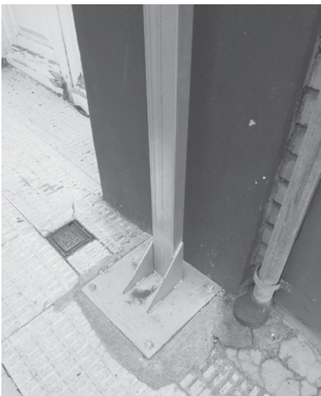
Detalle de los anclajes del soporte en señal de tráfico

A LIAGAS. A los anclajes de varios soportes de las nuevas señales de tráfico. En su sujeción al suelo de la acera, lleva unas pequeñas escuadras que sobresalen bastante del frente de dicho anclaje y sobre todo restan espacio en lugares donde la acera es estrecha, dificultando el paso de los viandantes con el peligro que eso conlleva de caídas sobre todo en personas mayores. Creemos que se pueden sujetar y dar refuerzo a la barra que sustenta la señal sin que sobresalgan sobre la acera. En esta época de invierno donde la luz diurna escasea, por la noche es un peligro constante y se puede evitar fácilmente.