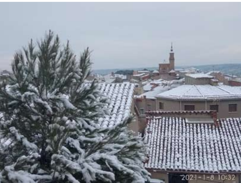
Panorámica de Calanda desde San Blas