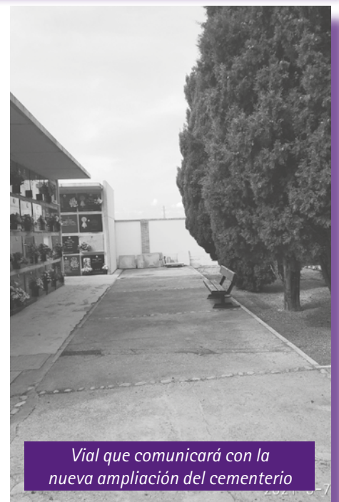
Vial que comunicará con la nueva ampliación del cementerio

La comunicación con el cementerio actual será a través de un vial proyectado al fondo de los dos recintos, justo enfrente de la puerta lateral que existe en el cementerio viejo ■