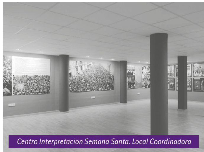
Centro Interpretación Semana Santa. Local Coordinadora