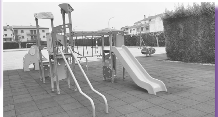
Juegos infantiles en el recreo

Nueva zona de juegos infantiles en el recreo de nuestro Colegio, ha sido llevada a cabo en colaboración entre el AMPA, Concejalía de Educación de nuestro Ayuntamiento y la dirección del Centro Publico "Virgen del Pilar". Los niños y niñas del CEIP ya pueden disfrutar de estas nuevas instalaciones ■