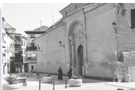
Sábado Santo, mediodía, tocando el tambor en la intimidad

C ORONA DE LAUREL. Al comportamiento ejemplar de todos nuestros vecinos de Calanda en esta difícil Semana Santa pasada. Han sido unos días tristes, nostálgicos, llenos de recuerdos, pero sin aglomeraciones, ni sonidos estruendosos, sin prisas ni horarios prefijados. Se ha tocado el tambor y bombo cuando fue permitido en la intimidad de la familia, con toques pausados a pesar de los nervios y las "ganas", con sentimiento y añoranza de los que nos acompañaban otros años y notando la ausencia dolorosa de los que nos han dejado. Laureles para todos aquellos que participaron con ORDEN, RESPETO Y ESPERANZA ■