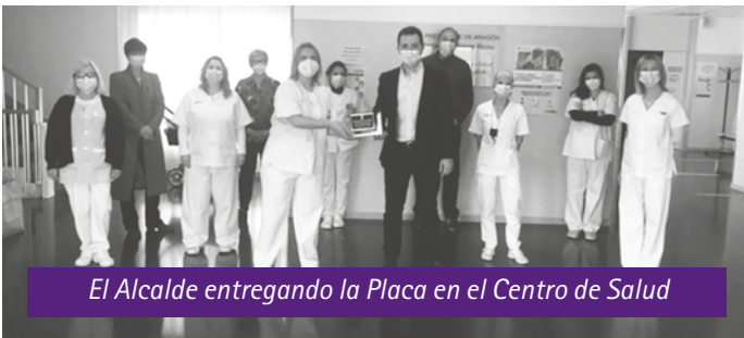
El Alcalde entregando la Placa en el Centro de Salud

Después de un año de difícil desde el punto de vista sanitario, el Ayuntamiento de Calanda, entregó una placa conmemorativa al Centro de Salud de Calanda y a todos sus trabajadores. Gracias por vuestro esfuerzo y dedicación. Por vuestro trabajo y cercanía con los habitantes de Calanda. Hemos vivido muchos días difíciles y siempre habéis estado ahí. En nombre de todo el pueblo de Calanda. GRACIAS ■