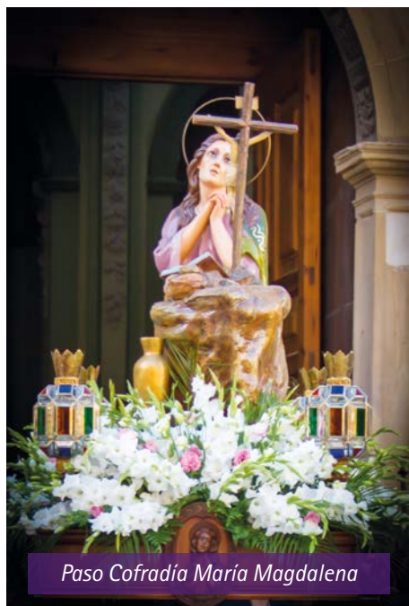
Paso Cofradía María Magdalena