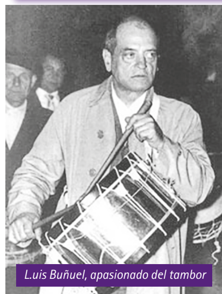
Luis Buñuel, apasionado del tambor