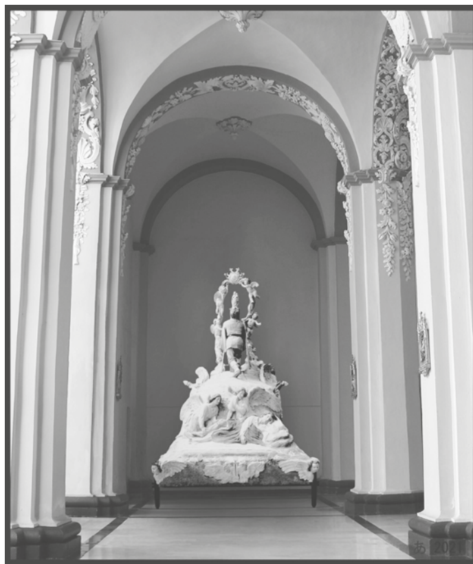
Lugar donde estuvo el paso durante muchos años