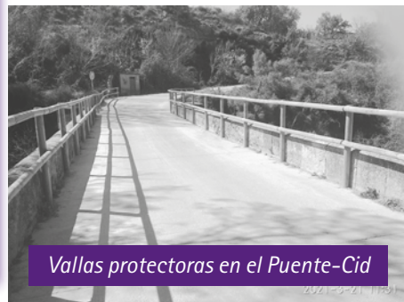
Vallas protectoras en el Puente-Cid

G RAN LAUREL, por la colocación de unas vallas de madera en todo el recorrido del Puente-Cid. Vallas muy necesarias, ya que los pretilos de piedra de dicho puente han quedado muy bajos con el transcurso de los años y eran un verdadero peligro asomarse para ver el Guadalopillo o los "riberos" colindantes., sobre todo a la gente menuda, y más todavía en estos tiempos que se practica mucho el senderismo, rutas con bicicletas y se disfruta de la Naturaleza al aire libre. Queda el tránsito por dicho puente protegido y al ser las vallas de madera especial tratada para estos cometidos no afea el paisaje ni la armonía de este tan antiguo y hermoso puente.