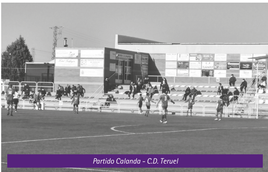
Partido Calanda - C.D. Teruel