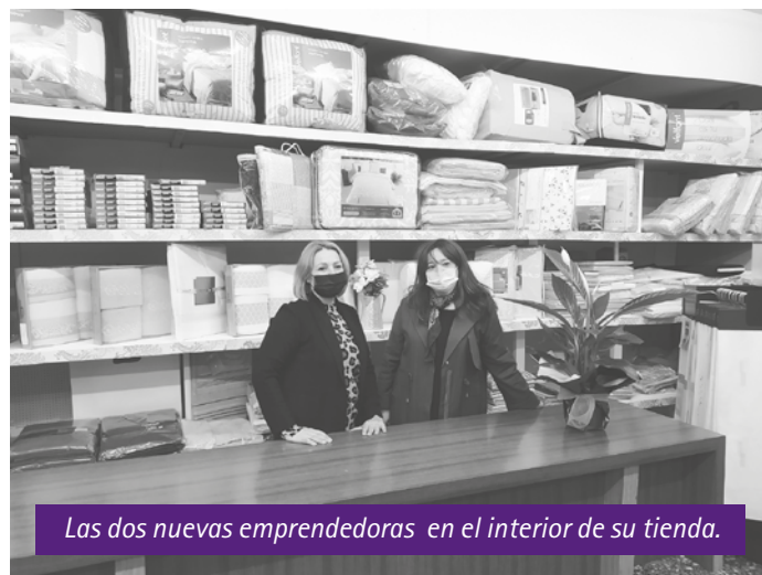
Las dos nuevas emprendedoras en el interior de su tienda.