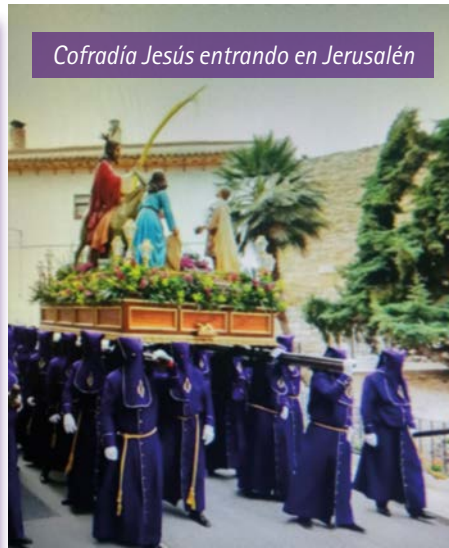
Cofradía Jesús entrando en Jerusalén

La pandemia ha cambiado muchas cosas, pero no nuestro sentimiento por esta tradición la cual renovamos año a año. Esperaremos, esperaremos con paciencia infinita, pero volveremos a juntar nuestras cuadrillas y aunar nuestros toques en un grito de liberación ■