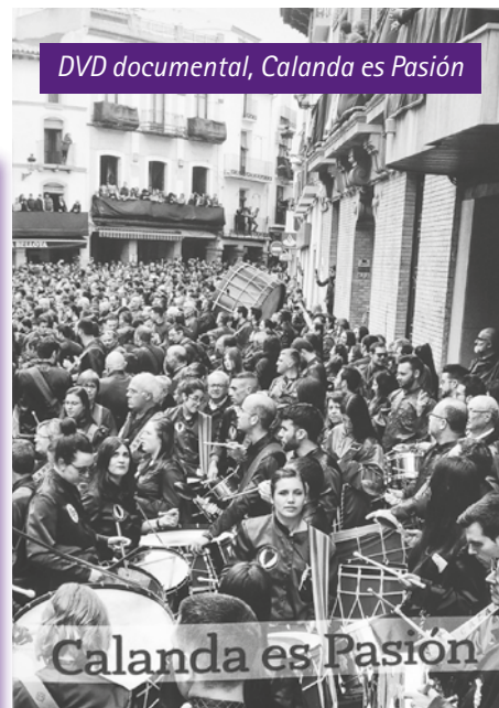
DVD documental, Calanda es Pasión