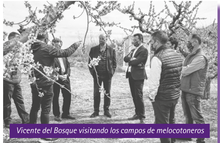
Vicente del Bosque visitando los campos de melocotoneros

Visitó el Ayuntamiento acompañado del Alcalde, Alberto Herrero y se fotografió delante del Bombo Grande que se encontraba en el patio del Ayuntamiento, al mismo tiempo que daba unos "toques" de maza en el bombo. Seguidamente hizo un recorrido por los campos y plantaciones de melocotoneros acompañado de agricultores, comercializadores y miembros de las cooperativas. Al finalizar hizo unas declaraciones para la