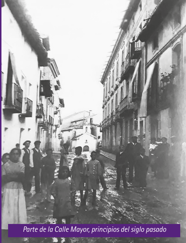
Parte de la Calle Mayor, principios del siglo pasado