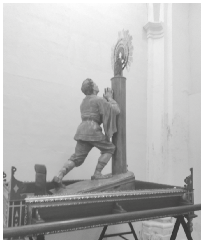
Peana actual del Milagro