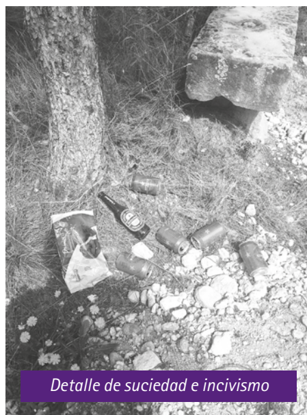
Detalle de suciedad e incivismo

Tienen a 50 mts, 4 contenedores a la entrada al Polideportivo, si llevan su suministro en bolsas o bien empaquetado, que empleen estas mismas bolsas para devolver los residuos a su sitio y no dejarlos esparcidos por el suelo como si fuese la seña de identidad del paso de los bárbaros por el Cabezo. Grandes ALIAGAS llenas de pinchos ■