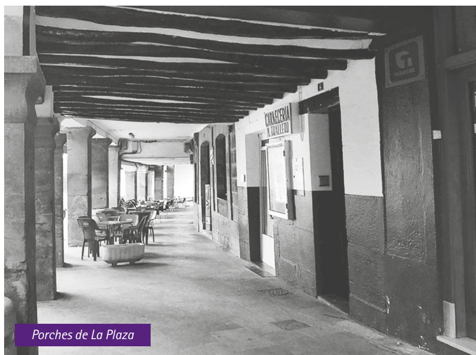
Porches de La Plaza

PRESIDENTA DE LA ASOCIACION DE COMERCIO, INDUSTRIA Y SERVICIOS DE CALANDA