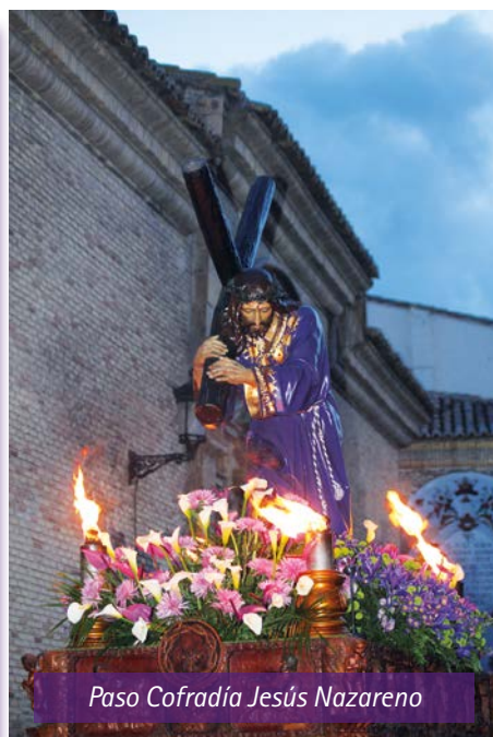
Paso Cofradía Jesús Nazareno

Este año tampoco ha sido un año normal, y en las puertas de nuestras casas, hemos realizado los actos programados, con nuestras familias y vecinos, aunque a todos nos ha sabido a poco, hemos podido disfrutar de nuestra tradición con un esfuerzo y responsabilidad por parte de todos. Esperemos los próximos años para vivir nuestra Semana Santa como siempre ■