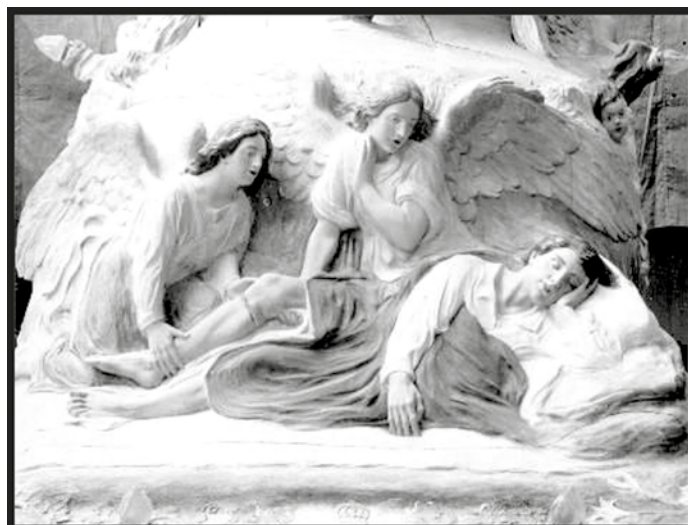
Detalle escena frontal Milagro