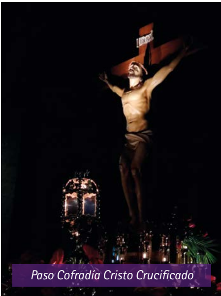
Paso Cofradía Cristo Crucificado