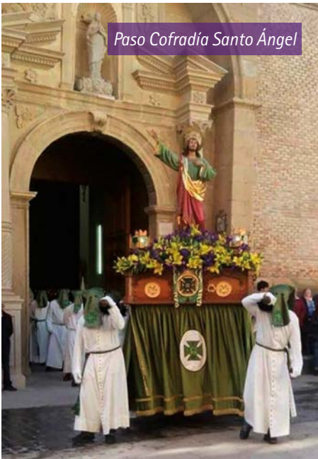
Paso Cofradía Santo Ángel