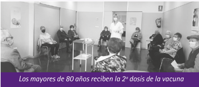
Los mayores de 80 años reciben la 2ª dosis de la vacuna

Después de un año de difícil desde el punto de vista sanitario, el Ayuntamiento de Calanda, entregó una placa conmemorativa al Centro de Salud de Calanda y a todos sus trabajadores. Gracias por vuestro esfuerzo y dedicación. Por vuestro trabajo y cercanía con los habitantes de Calanda. Hemos vivido muchos días difíciles y siempre habéis estado ahí. En nombre de todo el pueblo de Calanda. GRACIAS ■