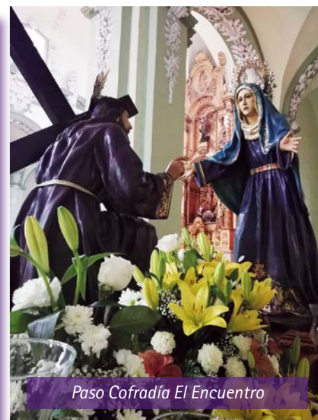
Paso Cofradía El Encuentro