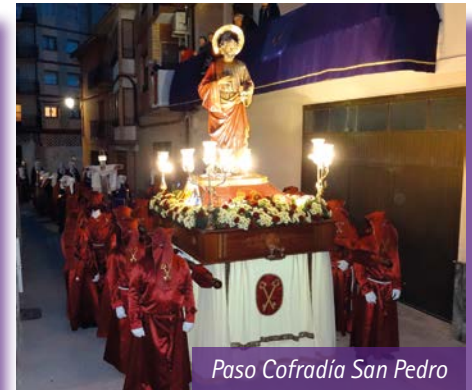
Paso Cofradía San Pedro

Pero hay que mirar hacia delante. Tenemos que mantener esa ilusión y pasión por la Semana Santa que tanto nos caracteriza a los calandinos. El domingo 10 de abril de 2022 se acerca. Los tambores volverán a inundar las calles de Calanda de morado. Y cuando eso ocurra, significará que la pandemia del coronavirus habrá terminado ■