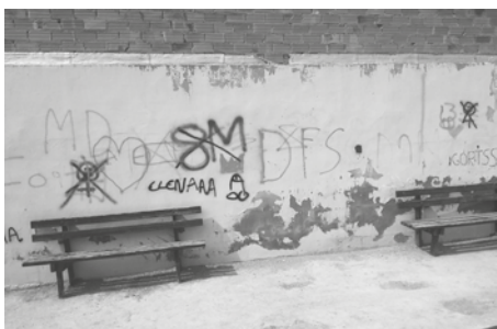
Los vándalos actuaron en el Parque del Lavadero

G RANDES ALIAGAS. Nos parece de maravilla que se disfrute de del buen tiempo y de la Naturaleza, pero, No nos parece nada normal y menos de seres civilizados que se empleen espacios dedicados al esparcimiento y al ocio como estercoleros o basureros. El segundo cabezo está lleno de residuos de "botellón" o de re-