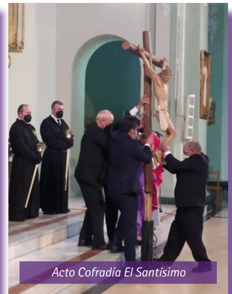
Acto Cofradía El Santísimo

Deseo es de toda la Cofradía que Nuestra Dolorosa nos acompañe y proteja de este mal bicho y que con todos en salud plena podamos celebrar el día 14 de abril del 2022 tres semanas santas de golpe ■