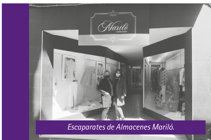
Escaparates de Almacenes Mariló.

Enhorabuena por mantener una puerta abierta, ser emprendedor nunca es fácil y más en época de pandemia y en un pueblo, dando un servicio por el cual muchos pueblos luchan ■