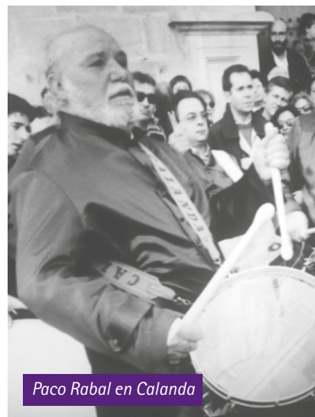
Paco Rabal en Calanda

Paco Rabal. Alpedrete, 13 de marzo de 1983