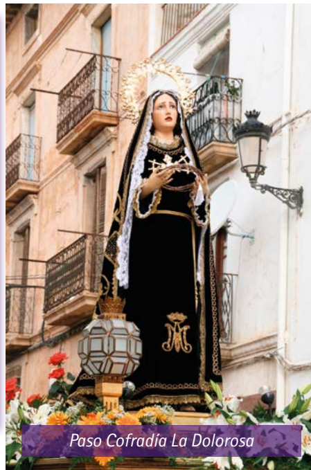
Paso Cofradía La Dolorosa

Tampoco hemos podido compartir la cercanía, vivencias y amistad que en estas fechas se produce entre los cofrades, ya que parte de ellos se encuentran en otras comunidades autónomas e incluso en otros países. Aunque somos optimistas para poder vivir la Semana Santa centrada en la persona en un futuro cercano, nadie nos podrá quitar el dolor y el llanto para quienes en estos dos años se han ido de nuestras vidas, de nuestra cofradía y de nuestra Semana Santa. Allá donde estén, prometemos que volveremos a vivir estas fechas como nos enseñasteis a sentirla y vivirla ■